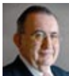
Manuel Arenas Presidente del Consejo Andaluz de Colegios de Farmacéuticos